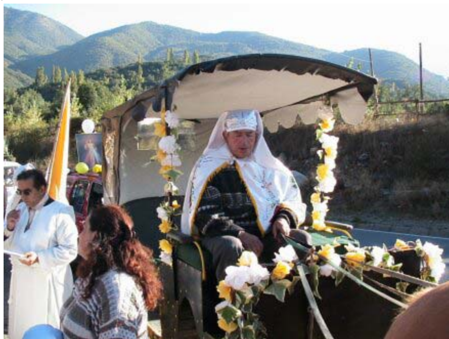
1. El birlocho en el Puente El Manzano

La fiesta de Cuasimodo se celebra en toda la zona central de Chile en el primer domingo después de Pascua de Resurrección. Esta palabra, " Cuasi Modo " viene del latín y significa " Al modo de... ", con lo que se hace alusión a las primeras palabras de la antífona de entrada a misa del Segundo Domingo de Pascua: Quasi modo génti infantes: "Como niños recién nacidos, busquen con ansias la leche pura del espíritu, para que por medio de ella crezcan y tengan salvación, ya que han gustado la bondad del Señor" .