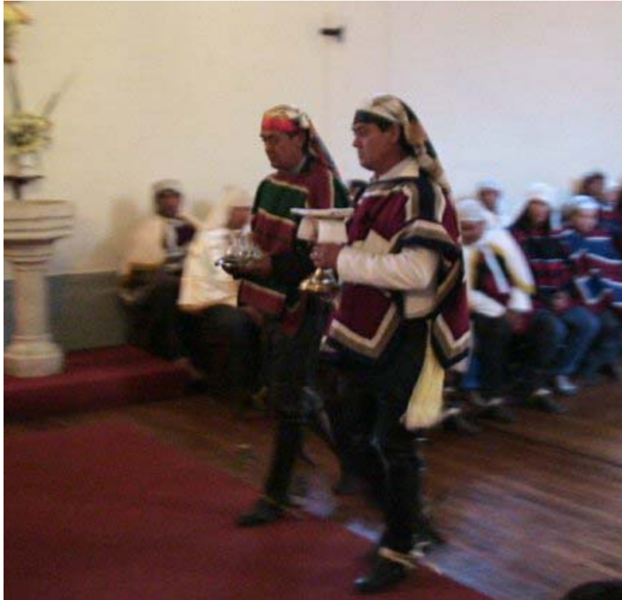
7. Se trae el Cáliz y el vino al altar