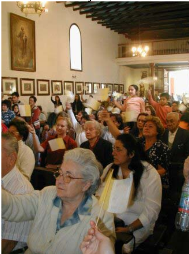
9. Vista de la congregación durante el homenaje al Santo Padre