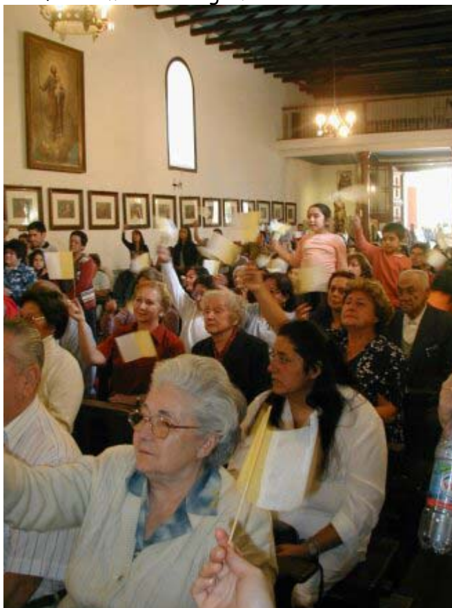
9. Vista de la congregación durante el homenaje al Santo Padre