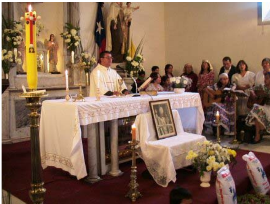
8. Durante la celebración de la Santa Misa